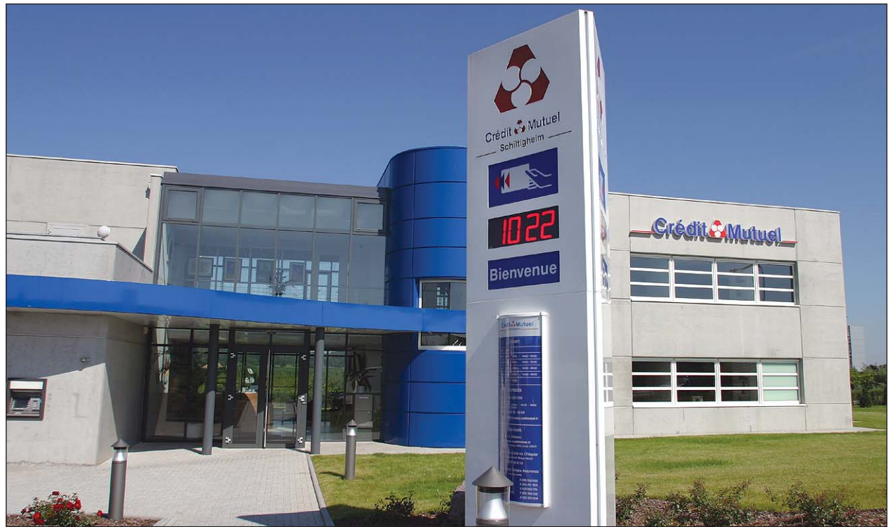
Au cœur de l'Espace européen de l'entreprise, la nouvelle Caisse est un outil de conquête vers de nouvelles clientèles (Photos Germain Schmitt).

De l'extérieur, le bâtiment apparaît compact avec ses façades de béton lissé gris, dont les lignes sont brisées par la verrière surplombant l'accueil et l'auvent abri-